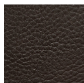
hot chocolate 60