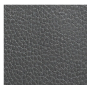
dark grey G6