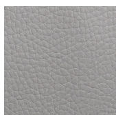
light grey G5