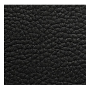
black coffee 59

Tutti i prodotti Luca Rossini sono disponibili in una vasta scelta di colori senza costi aggiuntivi!