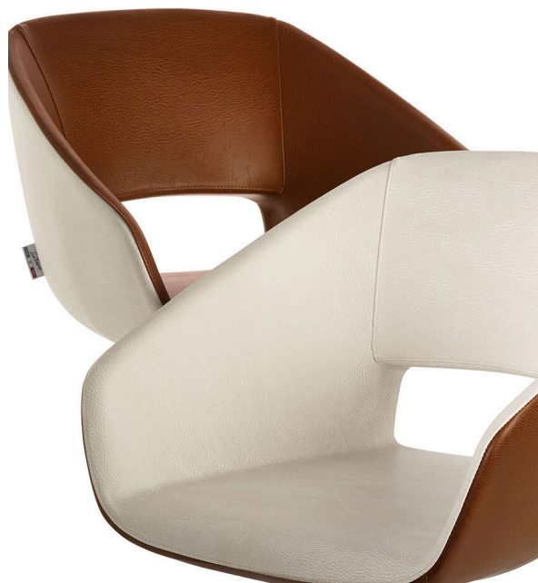
IN FOTO COLORI A: VINTAGE TAN G2 - B: VINTAGE WHITE G3 Le immagini sono fornite al solo scopo illustrativo e non costituiscono elemento contrattuale

Bellissima e confortevole, la poltrona Bea propone uno stile di tendenza, dal sapore retrò. La linea essenziale e la forma accattivante sono perfette - al tempo stesso - sia in ambienti dallo stile contemporaneo e moderno, sia in saloni dal look più vintage. Inoltre, la seduta, lo schienale e i braccioli imbottiti assicurano il massimo comfort. Disponibile in bicolore da scegliere su un'ampia gamma di colori senza costi aggiuntivi. Disponibile con base tonda o in alluminio a cinque razze, girevole o con pompa oleodinamica con freno.